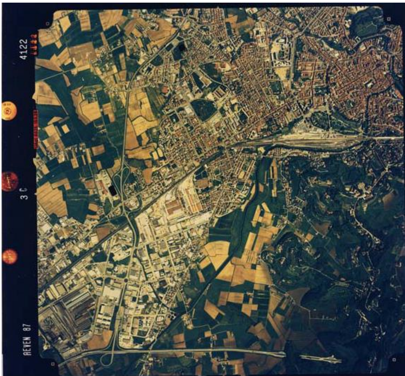
Centro urbano di Vicenza, Vicenza Ovest e zona industriale (1987).

A sud la zona industriale di Vicenza, in alto a sinistra Via del Sole (sulla sinistra la zona agricola di Vicenza-Monteviale-Creazzo, sulla destra la zona agricola dei Pomari trasformata in area edificabile), in alto a destra il centro storico di Vicenza, in basso a destra la zona agricola della Gogna e i colli Berici.