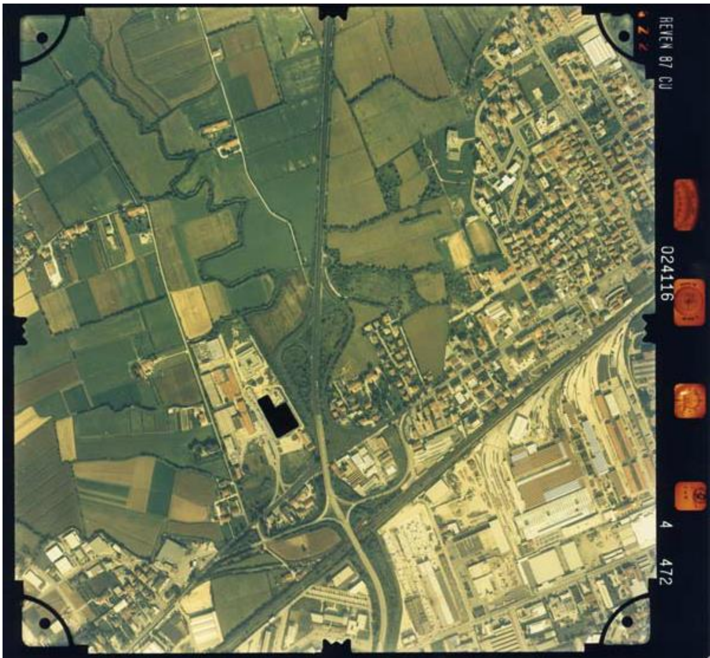
Vicenza Ovest, particolare della zona Pomari sud (1987).

Via del Sole al centro (sulla sinistra la zona agricola di Carpaneda a Vicenza, sulla destra la zona agricola dei Pomari e il quartiere S. Lazzaro), a sud la zona industriale di Vicenza (particolare dell'Officina Grandi Riparazione delle Ferrovie dello Stato).