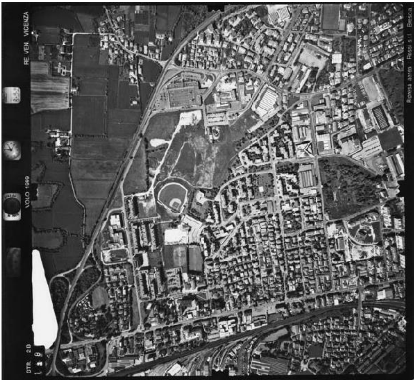
Vicenza Ovest, quartiere Pomari (1999).

Via del Sole ad est (sulla sinistra la zona agricola di Carpaneda a Vicenza, sulla destra il nuovo quartiere Pomari), a nord il centro commerciale Auchan e la zona Cattane, a ovest il quartiere S. Lazzaro, a sud le nuove edificazioni previste dal PP4. Lo spazio ineditato tra via del Sole, Auchan e il nuovo quartiere era lo spazio destinato alla creazione del Parco Natura Urbana.